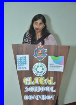
22 participants - 6 établissements européens